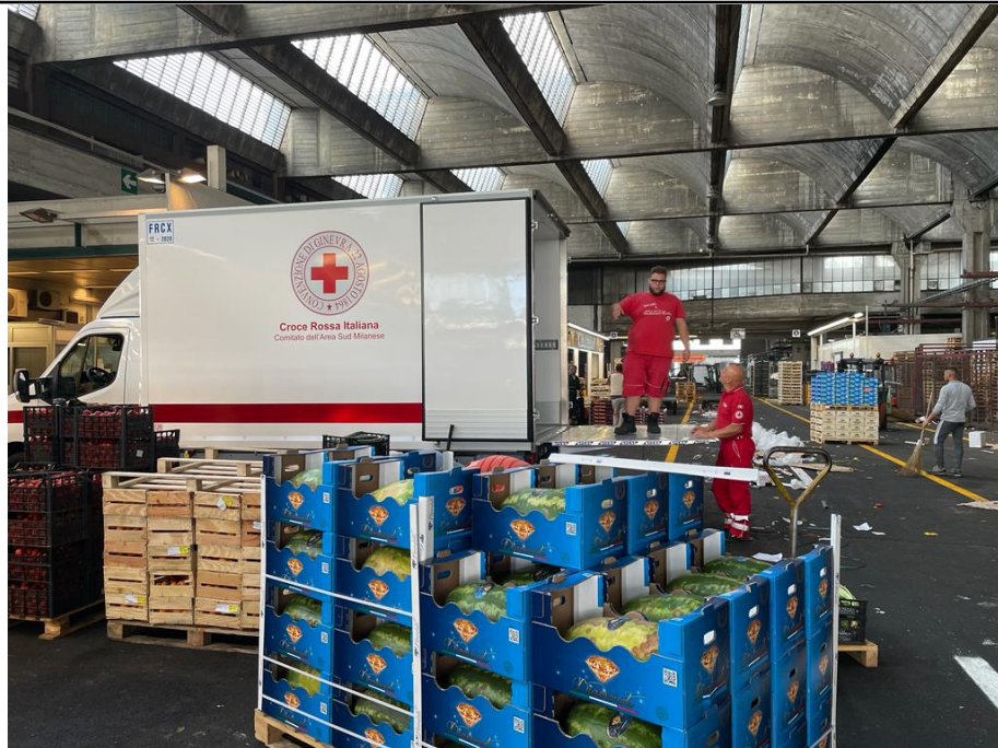
Consegna delle eccedenze alla Croce Rossa Italiana

Nel 2023 ha rafforzato l'impegno stringendo nuove partnership con soggetti che la possono aiutare nel recupero e nella valorizzazione dei prodotti, a cui vengono donate le eccedenze: Antoniano (Bologna); ACLI Roma; Fondazione Solidarietà Caritas ETS (Firenze); Fondazione Caritas San Saturnino (Cagliari); COOPI. Con In chiave sostenibilità si inquadra anche lo studio in corso, sempre da parte di Orsero, per estendere la shelf life dei prodotti.